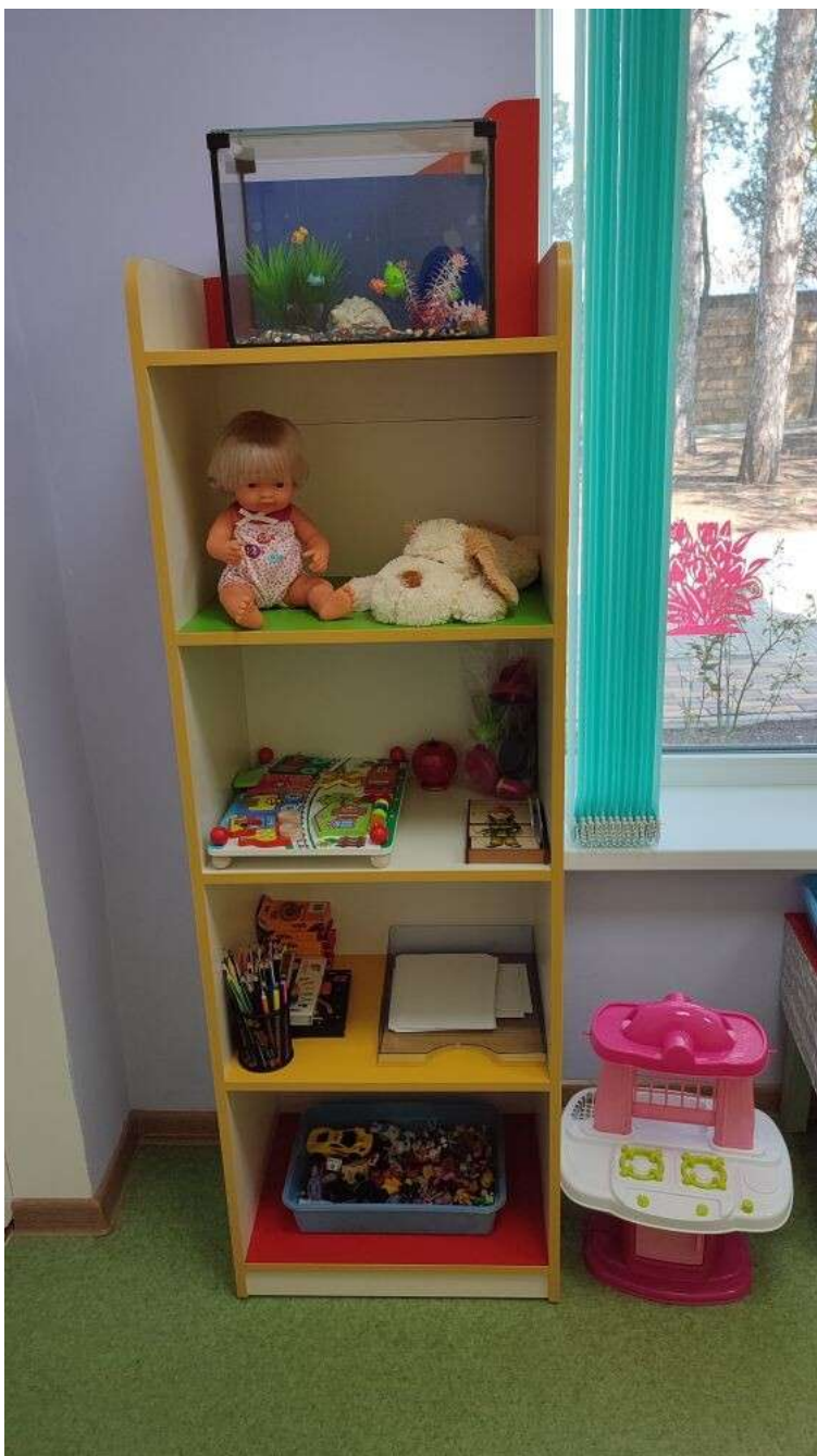
- стеллаж (1шт)